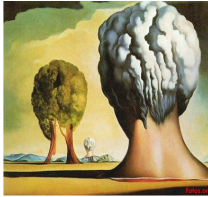
- العمل -2-