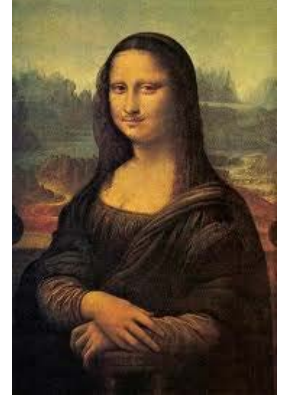
- العمل -1-

السؤال الثاني: يقول مار غريت ملخصاً فلسفته الفنية: