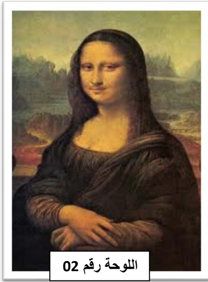
اللوحة رقم 02

السؤال الثاني: تأمل الصور التالية و أكمل الجدول التالي: