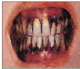
الوثيقة 2: أسنان شخص مدمن