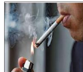
الوثيقة 1: شخص مدمن