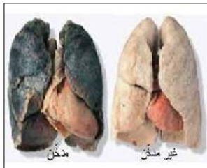
الوثيقة 3: رئة سليمة و رئة مصابة

التدخين يؤثر سلبا على صحة الإنسان حيث يؤدي إلى هزال الجسم و اصفرار الأسنان و الروائح الكريهة.