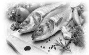
4- el pescado