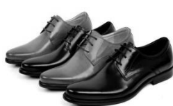
2- los zapatos