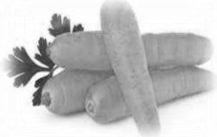
1- La zanahoria